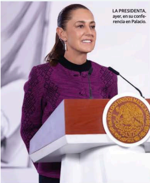
LA PRESIDENTA, ayer, en su conferencia en Palacio.

SHEINBAUM destaca registro de 27 víctimas en un día, la menor cifra en 14 años; aplaude el trabajo “titánico” del Gabinete de Seguridad; funciona estrategia, reafirma. pág. 12