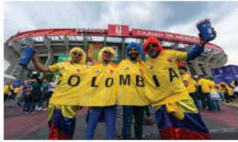
AFICIONADOS abarrotan el Estadio CDMX, ayer.

COLOMBIANOS PINTAN DE AMARILLO LA CDMX pág. 15