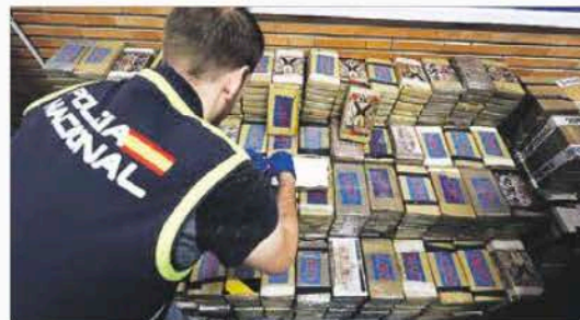
Incautación. Ubicaron coca, anfetaminas, euros en efectivo y criptomonedas.

En una acción conjunta, autoridades estadounidenses, neerlandesas y españolas detuvieron en España a 20 presuntos miembros del Cártel Jalisco Nueva Generación (CJNG) y desarticularon una oficina de ese grupo criminal. Algunos de los detenidos son objetivos prioritarios de la DEA. Hay miembros de la Camorra italiana. —David Saúl Vela / PÁG. 32