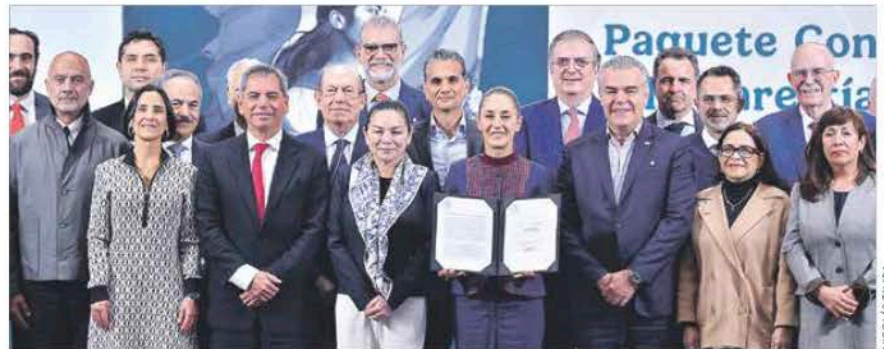
Firma del acuerdo en Palacio. La presidenta Sheinbaum agradeció a la IP la colaboración y voluntad para mantener el Pacic.