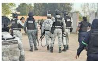
Salamanca es una zona en disputa por el control del combustible que se ordeña de la refinería de Pemex.