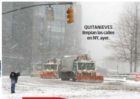
QUITANIEVES limplan las calles en NY, ayer.