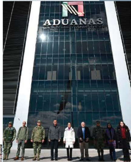
LA PRESIDENTA, ayer, con el gobernador de Tamaulipas, los secretarios de Defensa y Marina y otros funcionarios.