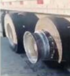
■ Delinquentes robaron las llantas de trailers llevados a la protesta.

El sector automotriz alertó por afectaciones a la cadena de suministros para plantas en México y EU, debido a los bloqueos de carreteras y aduanas.