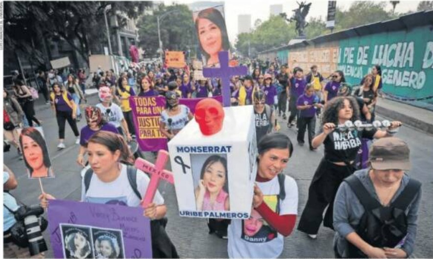
Con cartulinas que llevaban fotografías de víctimas, cientos de mujeres en la CDMX marcharon ayer para exigir justicia ante la violencia y que no haya impunidad.