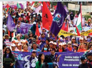
MANIFESTACIÓN de mujeres, ayer, en CDMX.

Se perseguirá de oficio; pena mínima de 15 años de cárcel y multa de $56,700; hay 34 agravantes; por cobro de piso, 33 años; a montachos y montadeudas se aplicará castigo máximo pág. 13