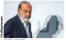
CARLOS Slim, ayer.

APLAUDE que la Presidenta priorice la inversión; hace falta detonar más, recalca; ve a Pemex como el principal problema. pág. 23