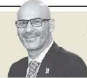
David Razú "El auge de la IA detona una ola de inversión en infraestructura" - P. 18

Conflicto. La Fiscalía capitalina informa por correo a la gobernadora sobre la inconformidad del senador, aunque aclara que no está imputada; aun así, la panista responde que es una "persecución política pura"