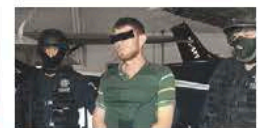
Operación en Sonora: Cae un sobrino de El Chapo con solicitud de extradición