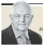
Martin Wolf "Legado de Powell: salir indemne del pleito con Trump" - P. 25