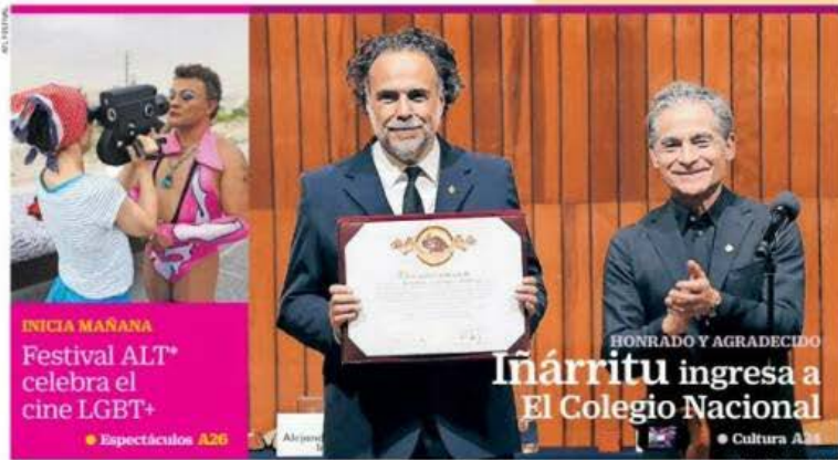
INICIA MAÑANA Festival ALT* celebra el cine LGBT+ ● Espectáculos A26